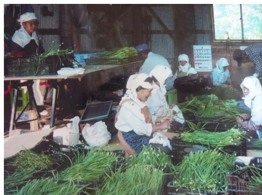
*写真はニラの選別作業とコンバイン運転講習

非農家を含めた集落全戸が知恵を出し合い、計画的な共同利用機械の購入や農道・水路の管理・補修を共同で実施、また、後継者対策として、若手農業従事者や退職後帰農者を対象にした農業機械の運転講習会、帰省時を利用した交流会を開催しています。さらに、高齢者や女性が活躍できる場として、町が推進している健康な土づくりによるミネラル栽培での園芸作物の栽培、特に集落近辺での被害が甚大な猿被害対策として食害にあいにくく、高齢者でも取り組みやすい「ニラ」の共同栽培などを推進し、農業所得の向上にも努めるなど、町内のどの集落よりも先がけてあらゆる対策を実践してきています。集落全体の話し合いから生まれた「出戸型集落営農」の実現が、生き生きと暮らせる集落づくりに欠かせない存在となった今、出戸集落の挑戦は続きます。