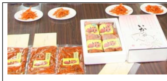
(販売開始されたいか人参)

「いか人参」は、北海道松前藩が、幕命で梁川の地に移封された際、松前藩士が古里を偲んで松前特産の真イカと梁川産の人参を漬け込んで味付けしたものとされています。この時期には欠かせない福島の郷土料理として、多くの人に愛されています。